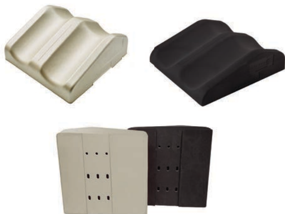
Orificios de indexado Kneefix