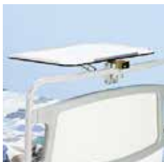
Bandeja de monitor 128009769