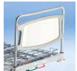
Respaldo de la cama 100009890 modelo 4-motores 100009990 2-motores + modelo hidr.