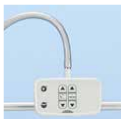
Panel de Control del paciente, luz de lectura y luz debajo de la cama (modelo 2 motores) A42964800