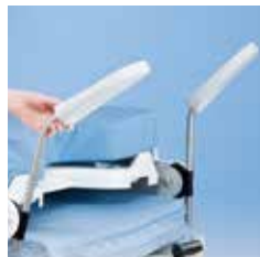
Apoya piés A42559000