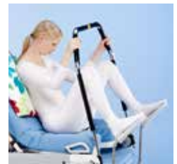
Barra de cuclillas A42749500