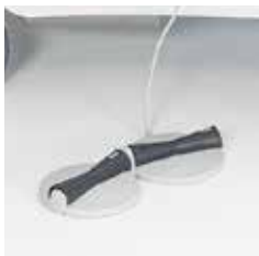
Interruptor de pie A42471800 para modelo 4-motores