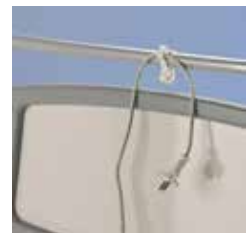
Gancho para cable eléctrico A41987307