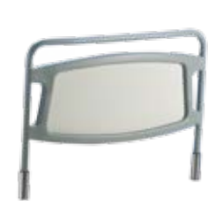
Respaldo de la cama, plegable A41935200 4-motores A41982900 2-motores + modelo hidr.