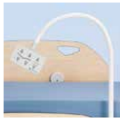
Panel de control del paciente, luz de lectura y luz debajo de la cama (modelo 4-motores) A42969100 Panel de control del paciente y luz debajo de la cama (modelo 4-motores) A43192000 (sin luz de lectura)