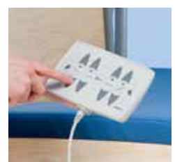
Mando de Enfermería ACO Para las enfermeras, con la posibilidad de bloquear los ajustes eléctricos, se pueden colocar, por ejemplo. Al extremo de la cabeza o en el riel lateral. Adecuado para modelo de 4 motores.