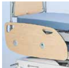
Rieles laterales A42718200 modelo 4-motores A42750700 2-motores + modelo hidr.