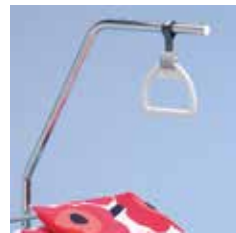
Palanca de elevación A41884100