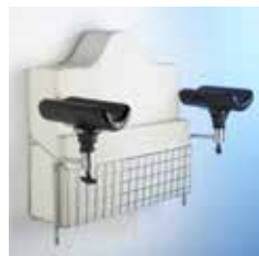
Cesta para colchones 10003974