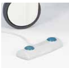
Interruptor de pie A42965600 para modelo 2-motores