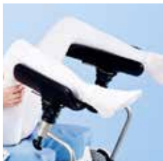
Perneras, par A42462200