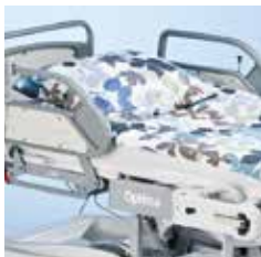
Rieles laterales A42200100 modelo 4-motores A42801000 2-motores + modelo hidr.