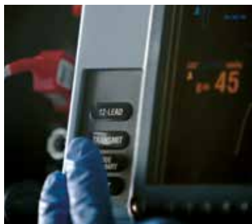
Conectividad de datos

La función de autocomprobación de la unidad avisa a nuestro equipo de servicio si el dispositivo requiere atención. Nuestro mantenimiento y reparación in situ, acceso a piezas originales del fabricante y técnicos experimentados y altamente capacitados le aportan la tranquilidad de saber que su monitor LIFEPAK 15 estará siempre listo cuando lo necesite.*