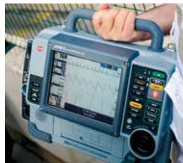
Pantalla de LCD de modo dual con pantalla SunVue