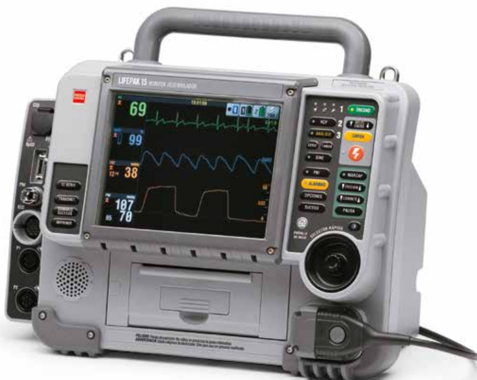
LIFEPAK ® 15 MONITOR/DEFIBRILADOR Para servicios médicos de urgencias